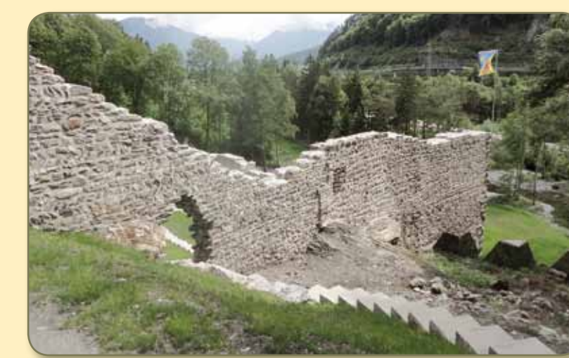
Nordfront 2012 gesichert und ergänzt. Die Mauerergänzung stützt die alten Mauern und lässt den Gesamtzusammenhang erkennen.