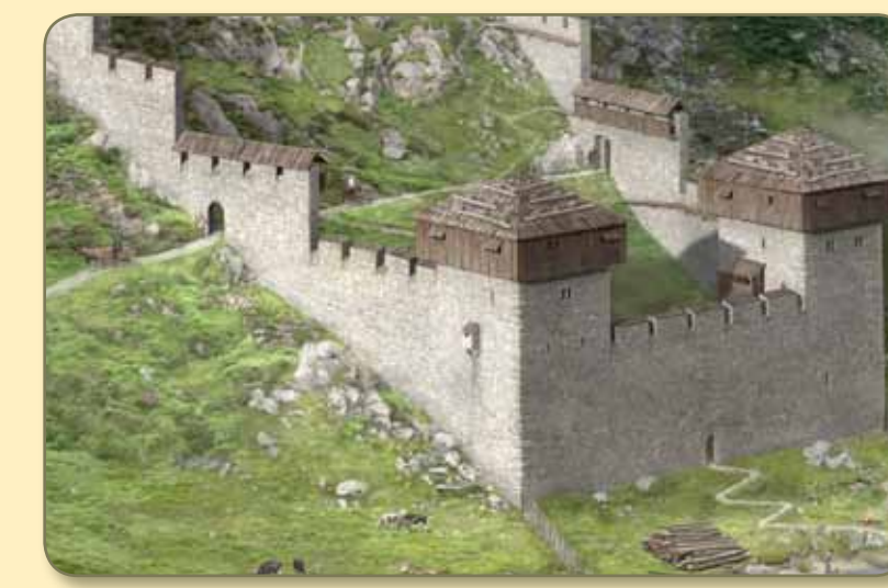
Das symmetrische Baukonzept sieht bei Baubeginn zwei gleichartige Ecktürme vor.