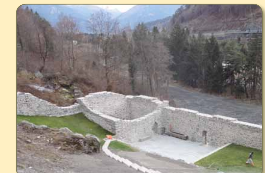
Südturm statisch gesichert mit neuer Nordfront und Nordecke.