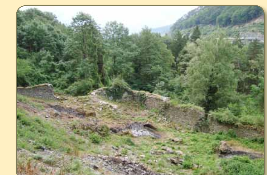
Südturm von Norden, Vorzustand 2010 nach dem Ausholzen.