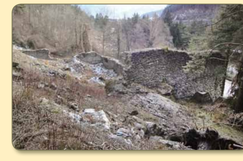
Nordfront Vorzustand 2010 nach dem Ausholzen.