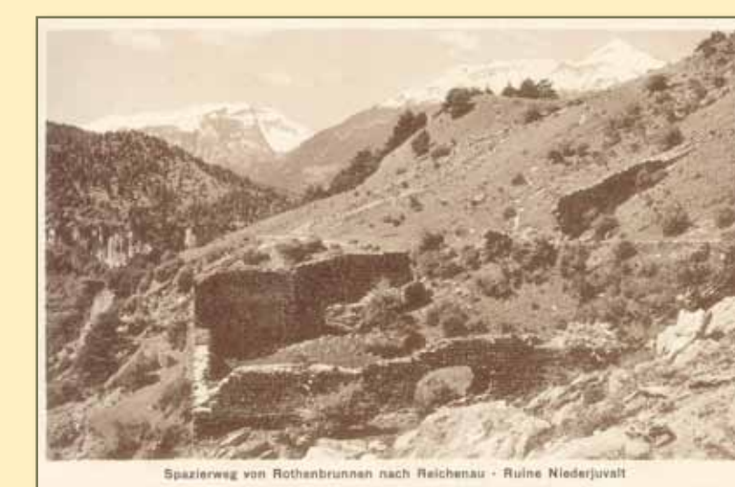
Postkarte aus der Zeit des Badetourismus nach Rothenbrunnen am Ende des 19. Jahrhunderts. Den Gästen sollte ein romantischer Spazierweg geboten werden. Der Ausbruch in der Ostflanke führte im 20. Jahrhundert zum Einsturz der ganzen Mauerpartie.