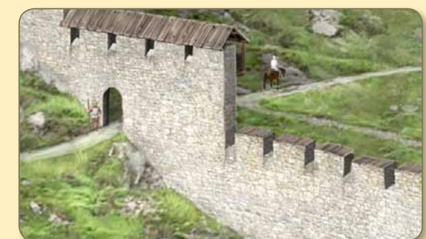
So mag der Weg durch die Talsperre im 13. Jahrhundert ausgesehen haben. Wenn die Sperrbalken der Burgtore beim Eindunkeln gezogen waren, ruhte jeder Verkehr nach Süden.

Aber durch das ganze Mittelalter wälzt sich auf dem gut karrenbreiten Strässchen der gesamte Nord-Süd-Verkehr durch die bischöfliche Talsperre der Herren von Juvalt: Säumer und Fuhrleute mit Stoffen aus lombardischen Städten, mit Gewürzen von den Märkten in Venedig, mit Specksteingeschirr und Wein aus Cläven, Waffen und Rüstung aus den Mailänder Werkstätten. Es begegnen sich Rompilger und Reisige, Bettler und Herren, es führt kein besserer Weg nach Süden. Mit der Auffassung der Talsperre nach 1450 verliert die Strasse ihre Bedeutung nicht.