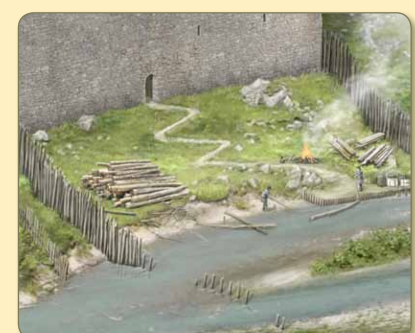
Burgen am Wasser haben grosse Vorzüge: Direkter Zugang zu sauberem Wasser und reichen Fischgründen, Brennholz wird vom Fluss als Schwemmholtz angetragen.

Wichtigstes Gebäude bleibt nun der Südturm, der wie fast alle Burgtürme über einen Hocheingang erreicht wird. Das noch teilweise erhaltene Kellergeschoss ist Vorratsraum und zeigt uns darum auch keine Baudetails eines Wohngeschosses.