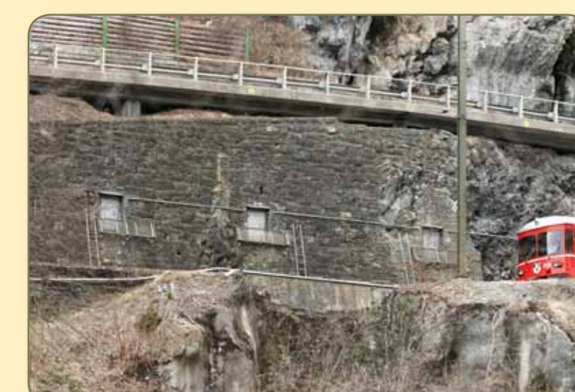
Auch das gehört zu einer Sperrstelle: Die permanenten Sprengobjekte im Polenweg, in der Kantonsstrasse und im Isla-Bella-Tunnel der N13. Hier drei der vier Sprengkammern der Kantonsstrasse mit 1600 kg Ladung. Der Sprengschutt hätte das Trasse der RHB schwer verschüttet und so die dortige Bahnsperre massiv verstärkt.

Nach der Niederlage Frankreichs sind am 20. Juni 1940 zwei polnische Schützendivisionen mit 13'000 Mann im Jura über die Grenze gekommen und interniert worden, sie helfen bis zum Kriegsende in der ganzen Schweiz beim Bau von Wegen und Strassen.