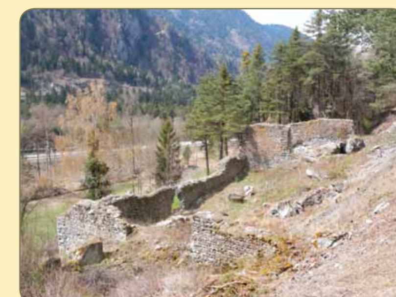
Talsperre von Osten. Vorzustand ausgeholt im April 2010. Die Übermauerung des Rheintörleins ist 1995, das Mauerwerk über der Bresche im Vordergrund schon vor dem 2. Weltkrieg eingestürzt.