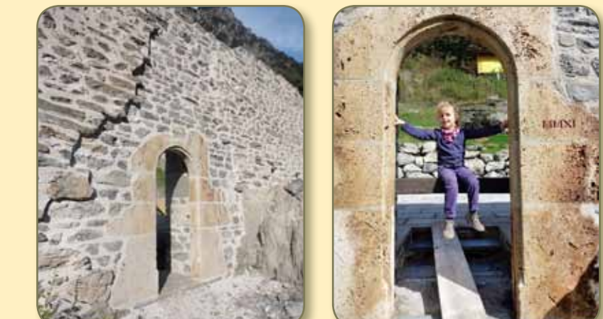
Rheintörlein: Vorzustand, Aufbau, Schattenfuge zum Sichtbarhalten der Ergänzung, Datierung.